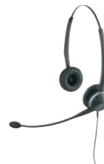
c d GN2100 Serie