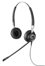
k l m n o BIZ 2400 Serie