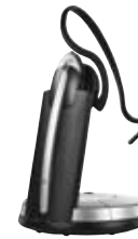
A B C GN9300 Serie