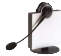
D E F G GN9120 Serie