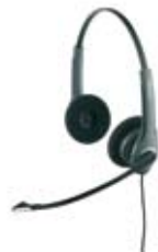
f g h i j p q GN2000 Serie