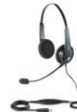
r s BIZ 620 Serie