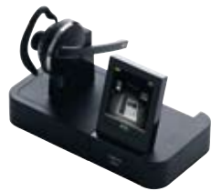
A B C PRO 9400 Serie