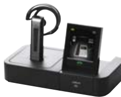
D GO 6400 Serie